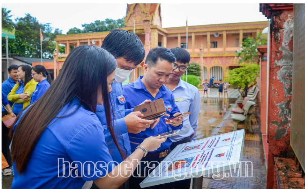
Đẩy mạnh các hoạt động chuyển đổi số trong cộng đồng.

Chiến dịch Thanh niên tình nguyện hè là phong trào hành động cách mạng được tổ chức thường niên của các cấp bộ đoàn. Trong năm 2023, chiến dịch Thanh niên tình nguyện hè tại Sóc Trăng đã được triển khai với nhiều đổi mới trong nội dung, cách thức tổ chức thực hiện. Từ đó, đã tạo dấu ấn đậm nét về màu áo xanh và tinh thần xung kích, tình nguyện vì cộng đồng của tuổi trẻ toàn tỉnh.