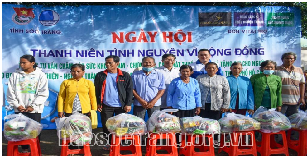
Tặng quà cho gia đình chính sách, người dân có hoàn cảnh khó khăn.